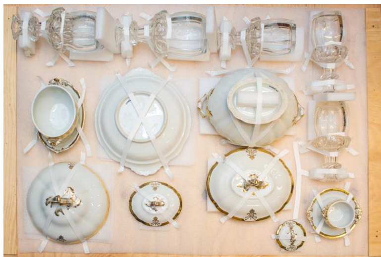
Speisegarnitur aus der Kaiserhaussammlung der Landessammlungen Niederösterreich