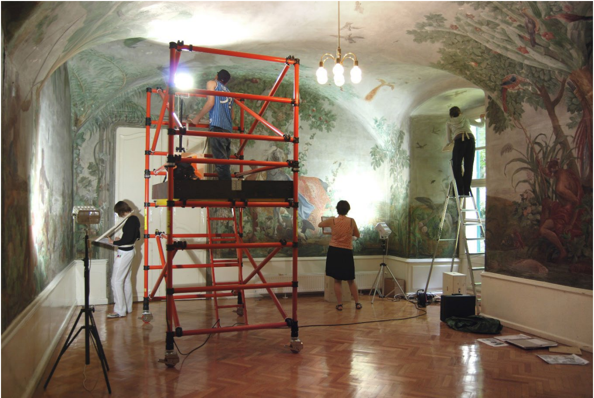
Kartierungsarbeiten im Schloss Ober St. Veit, Wien