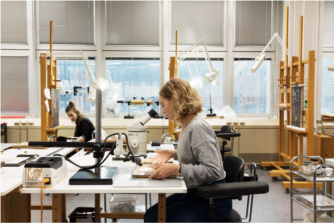
Arbeitssituation im Atelier für Konservierung und Restaurierung von Gemälden und Skulptur